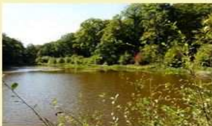
Forêt de Sainte-Apolline 16 Km avec Gérard