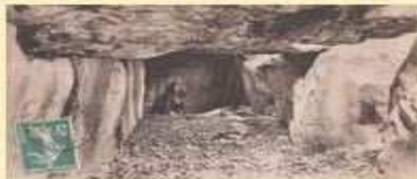
Forêt de Carnelle 25 Km avec PASAPAS