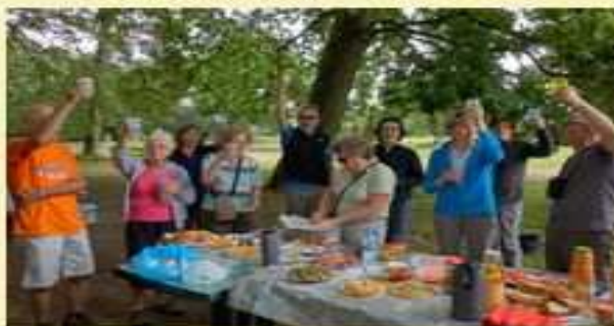
Pique-Nique "Chacun, Chacune en Amène un Petit Peu" 20 Km avec le Club